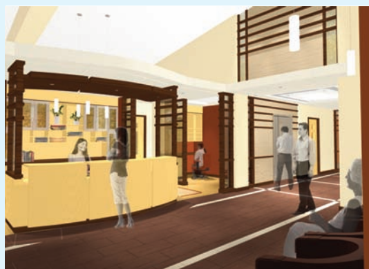
Rez-de-chaussée vue du hall et du poste d'accueil