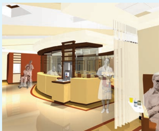
Rez-de-chaussée vue du poste de garde de l'aire de traitement