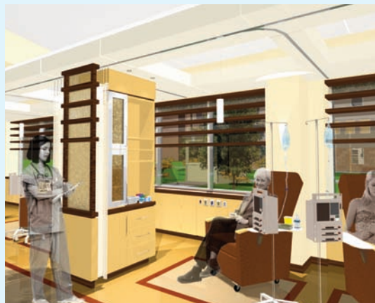
Rez-de-chaussée vue d'un fauteuil de traitement

Le projet de Centre interdisciplinaire de lutte au cancer du CHAU Hôtel-Dieu de Lévis nécessitera un investissement de 2,8 millions $ et le début des travaux est prévu pour l'automne 2009. Partenaire du projet, la Fondation Hôtel-Dieu de Lévis investira une somme de 875 000 $ afin de rendre possible sa réalisation.